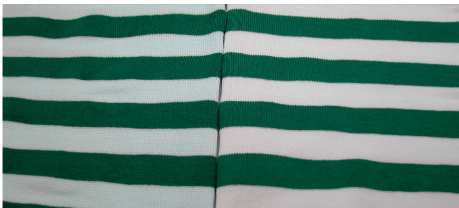
2,0g/l WEMADYE CO 2,0g/l Dispersante para Poliéster